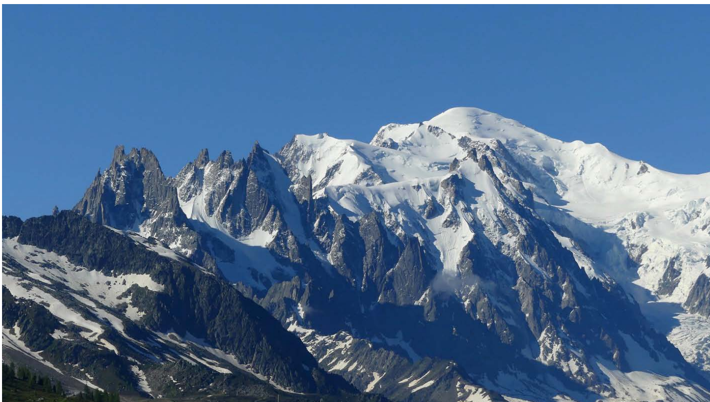
Massif du Mont Blanc

Vendredi 2 juillet : télécabine + télésiège du Tour. Premier départ à 9h. Arrivée en dessous du col de Balme en un quart d'heure. Départ du sentier (2181m) qui monte au refuge Albert 1 er (2702m). Compter environ 2h de montée. Bon sentier avec de jolis points de vue sur le Mont-Blanc, la Verte, les Drus et enfin l'Aiguille du Chardonnet. Neige en fin de parcours. Prévoir bâtons à minima ou mieux un piolet. Crampons utiles ensuite si on progresse sur le glacier. Après un pique-nique face à l'Aiguille du Chardonnet, équipés, nous sommes allés sur le glacier et avons atteint la côte 3060. Photos du soir depuis le refuge très confortable et moderne prévu pour 140 personnes sur trois niveaux... Nous avons eu la petite chambre de quatre places pour nous trois !