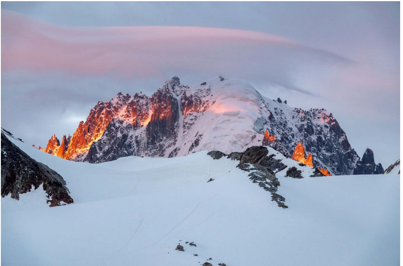
Aiguille Verte (4122m)