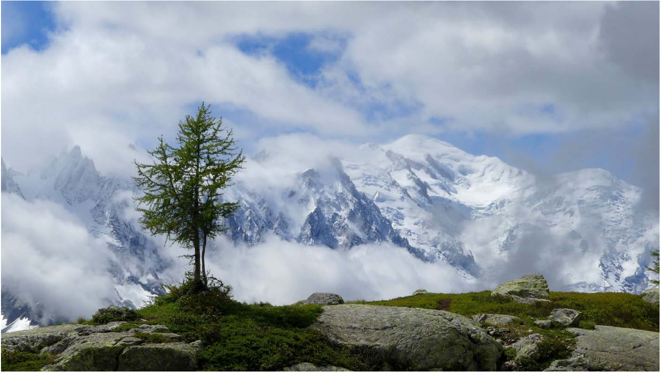
Apparition du Mont Blanc

Jeudi 1 er juillet : descente au col des Montets. Compter environ 2h30 + les arrêts. Nous avons rencontré les personnes chargées de baliser le chemin pour la marathon.