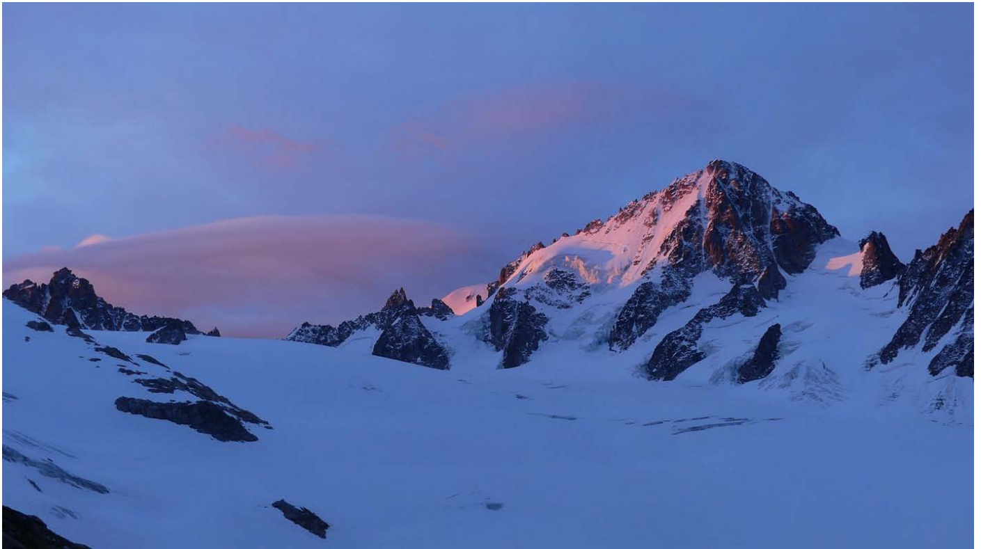
Lumières du matin sur l'Aiguille du Chardonnet

Samedi 3 juillet : photos du matin et descente par le même itinéraire. Montée au col de Balme tout proche (10 minutes depuis le haut du télésiège). Chocolat en Suisse ! Retour par le télésiège et les œufs.