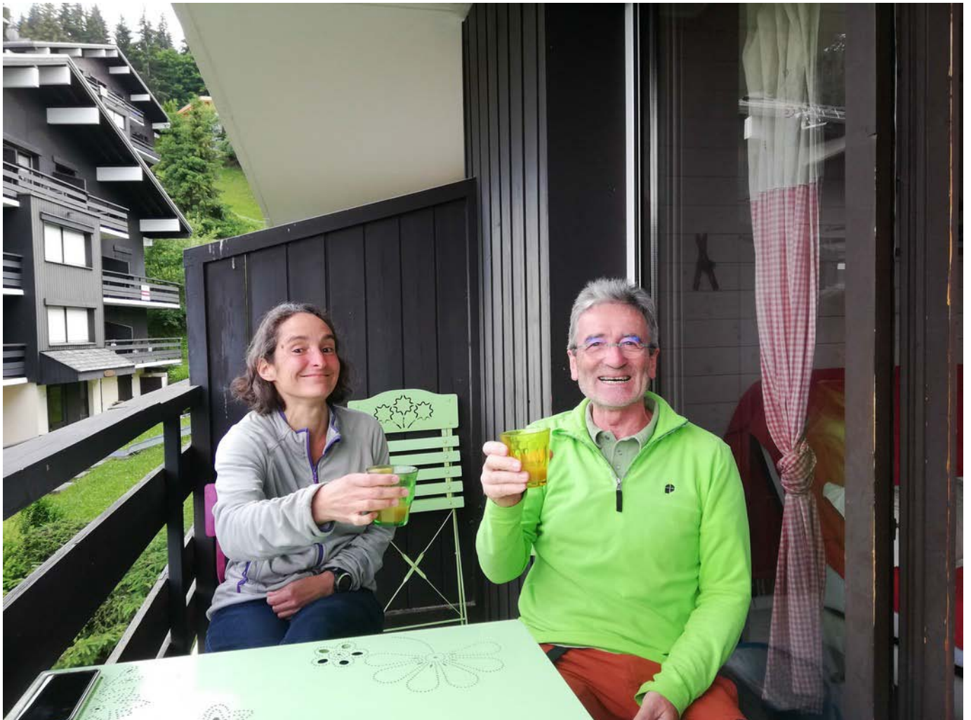
Terrasse à St-Gervais