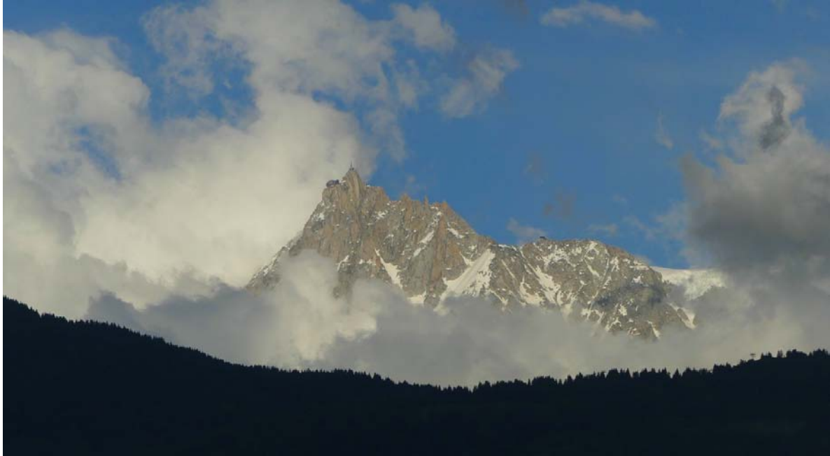
Aiguille du Midi (3842m) depuis Combloux