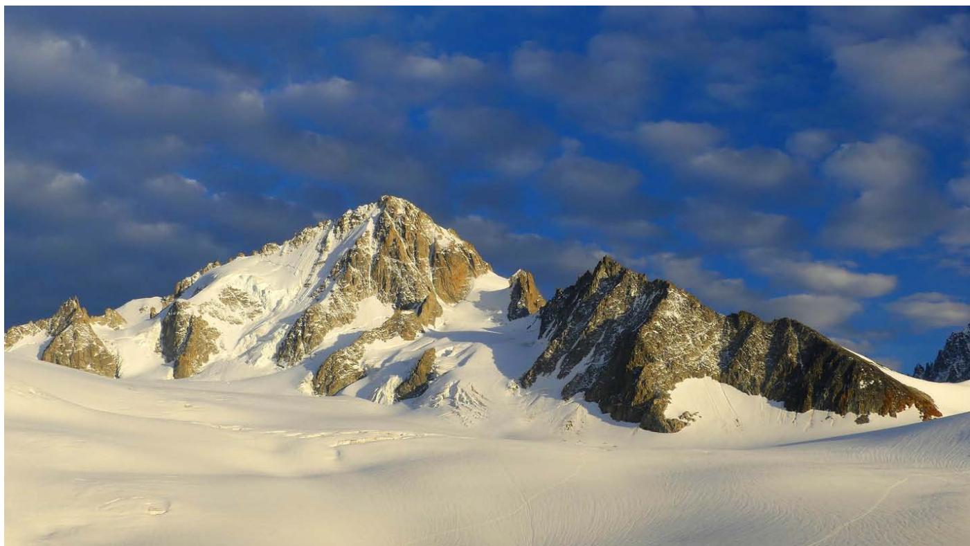
Aiguille du Chardonnet 3824m