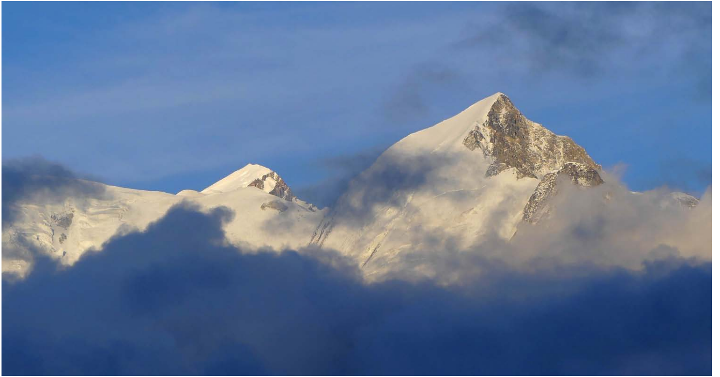
Aiguille de Bionnassay 4052m