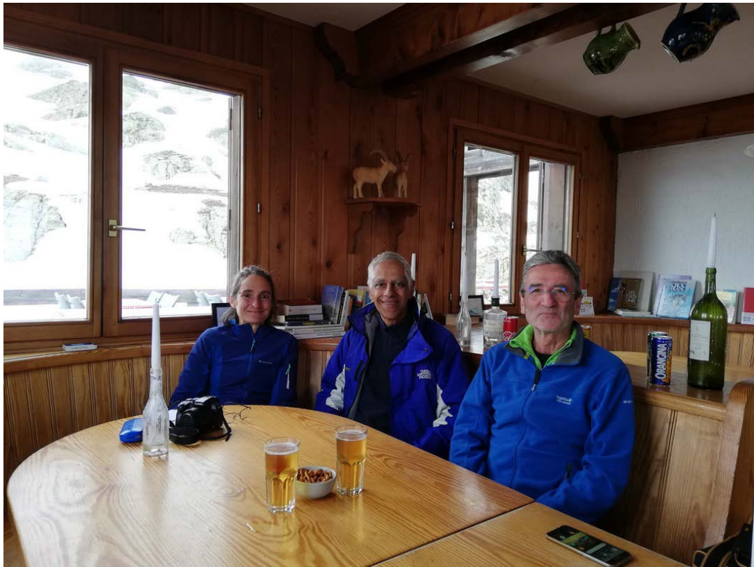
Refuge du Lac Blanc