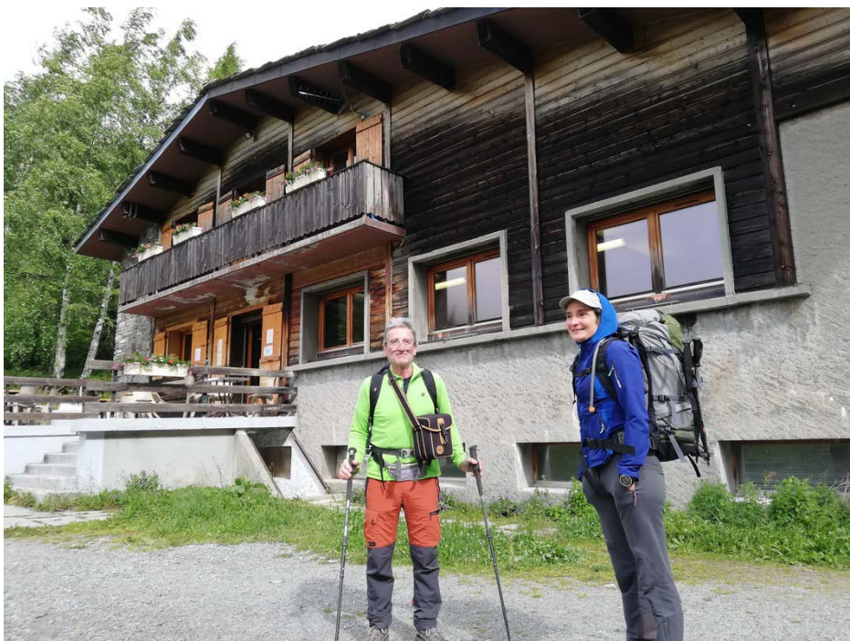
Départ pour le Lac Blanc

Mercredi 30 juin : montée au Lac Blanc depuis le col des Montets (1461m). Compter environ 3h + les arrêts. Pique-nique sur la terrasse du refuge. Installation et photos alentour. Bouquetins sur l'itinéraire et belles vues sur la Massif du Mont-Blanc (par temps clair!). Neige autour du refuge et échelles en fin de parcours.